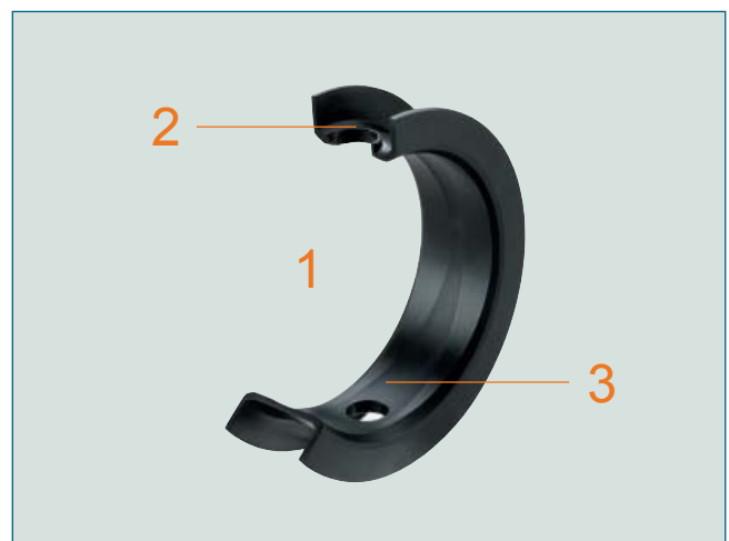
Obr. 2: Vodivá manžeta z PTFE.